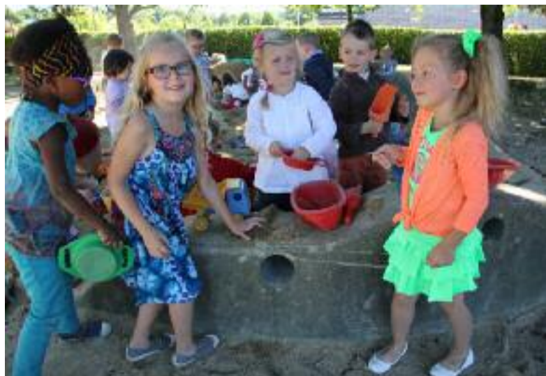
Jeux de bac à sable à l'école de Kerven.