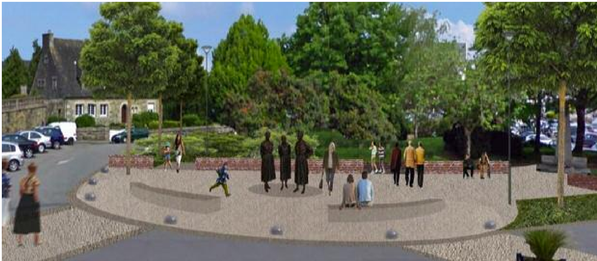
L'esquisse du réaménagement du haut de la place du Champ de Foire réalisée par les cabinets Archipôle et Terragone.

La phase de réaménagement du haut de la place du Champ de Foire, avant la pose des statues des Soeurs Goadec, vient de démarrer.