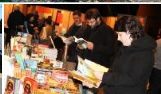
Page 19 : L'Europe au coeur du Festival du Livre