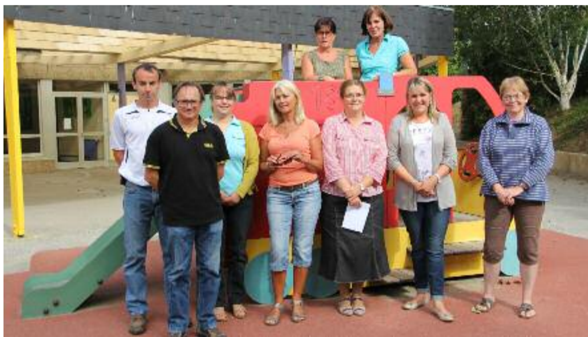
La cour de l'école de Kerven a été agrandie l'année dernière.