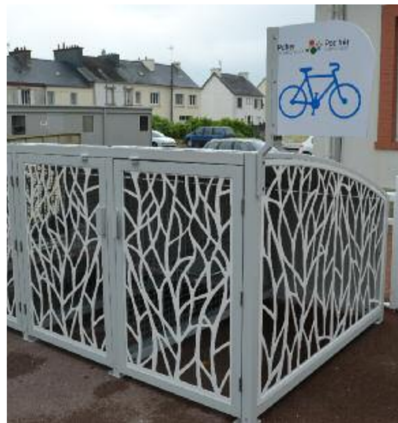
8 boxes à vélo, en libre service et gratuits, ont été installés à la gare pour les cyclotouristes et tous les cyclistes du secteur.

36 bornes à vélos ont par ailleurs été installées à Carhaix (Office de Tourisme, place de la Mairie, place du Champ de Foire et place de la Tour d'Auvergne) et dans les centres-bourgs de Kergloff, Le Moustoir, Motreff, Plounévezel, Poullaouën et Saint-Hernin.