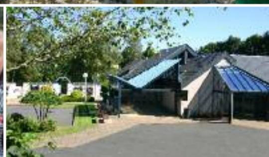
Page 18 : Les 25 ans du premier crématorium de l'Ouest