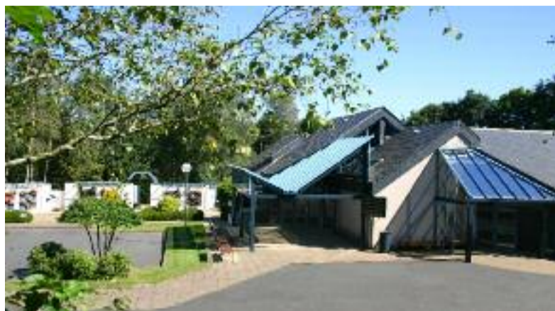
Le crématorium est situé route de Brest.

Quand il a ouvert le 14 septembre 1988, le crématorium de Carhaix était le seul du Grand Ouest. L'Hexagone n'en compte alors que 29. Retour sur l'histoire d'un crématorium militant et associatif.