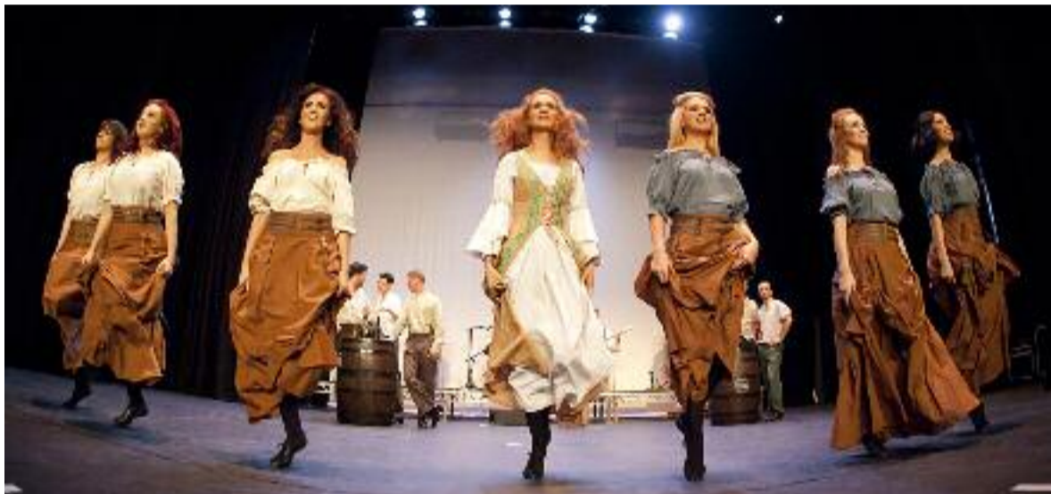
Baptiste Lecaplain, Im Takt, le Music Hall Opérette, Danièle Evenou, West Connemara Story seront à l'affiche du Glenmor.

14h30, médiathèque municipale. À partir de 5 ans. Gratuit.