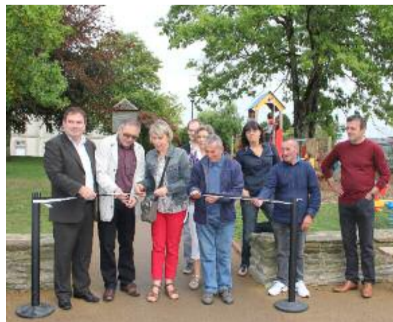
Élus, représentants d'Échanges et Cie, du Claj, de la bibliothèque, de l'école de musique du Poher et du foyer logement ont coupé le ruban inaugural le 29 septembre dernier.

En parallèle, une porte vitrée automatique a été installée à l'entrée du Château Rouge pour faciliter l'accès au