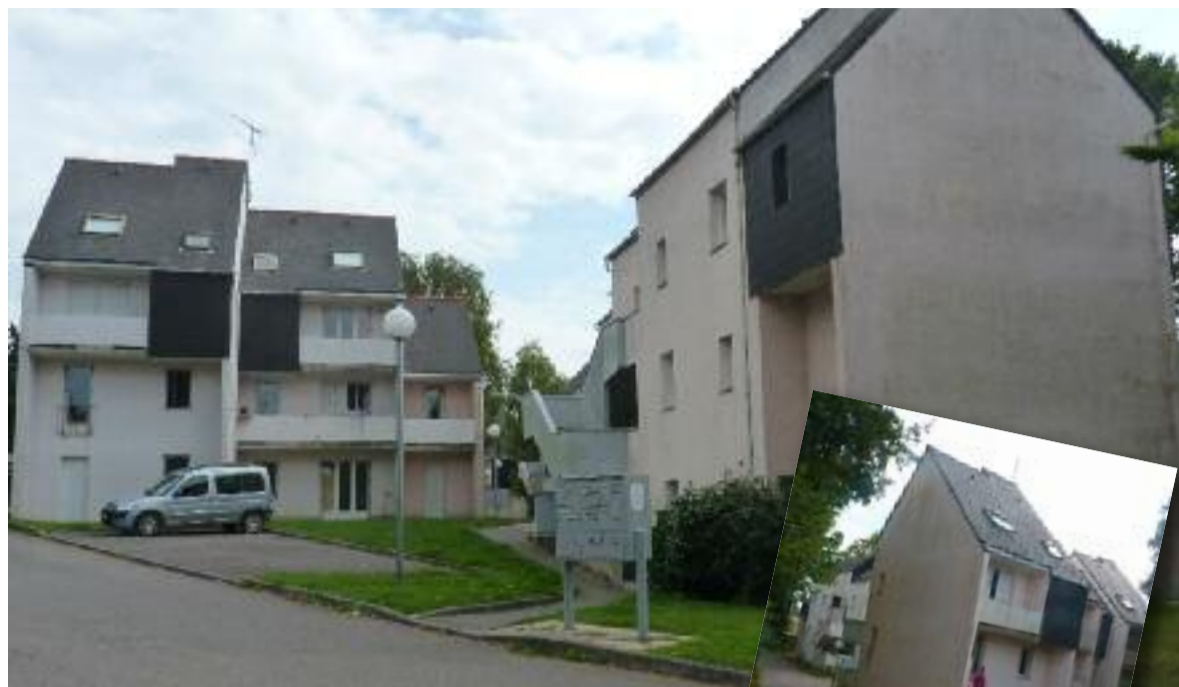
Rue Quijeau (ci-dessus) et impasse Cario (ci-contre), 57 logements seront réhabilités par Aiguillon Construction. La Ville apporte sa garantie pour un prêt d'honneur.