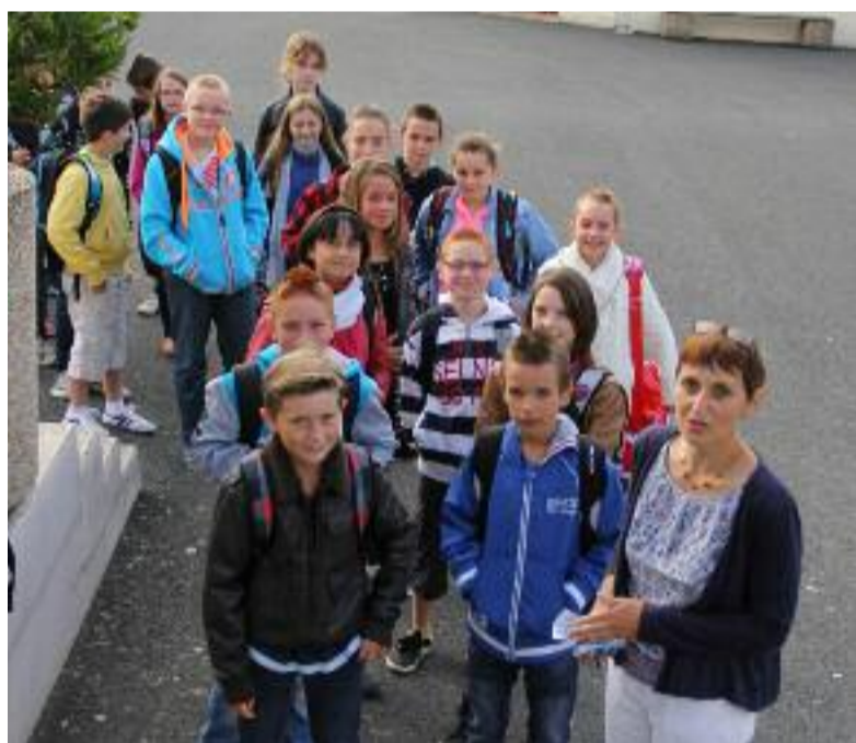
Les 6e reprennent le chemin des classes à Saint-Trémeur.

L' Établissement public médico-social (EPMS) a fait le plein avec 91 jeunes inscrits de 6 à 22 ans. Quatre nouveaux enseignants y ont fait leur rentrée. La reconstruction des ateliers de formation professionnelle, suite à un incendie il y a un an et demi, devrait être engagée courant 2014.