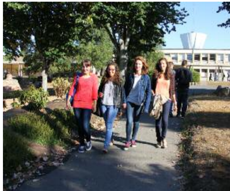
Les amis se retrouvent en groupe à la récré, au lycée Sérusier.