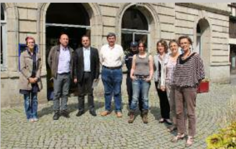
Les partenaires des forums de sensibilisation dans les grandes surfaces.