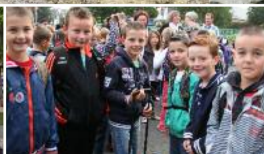
Pages 12 et 13 : Retour sur la rentrée scolaire