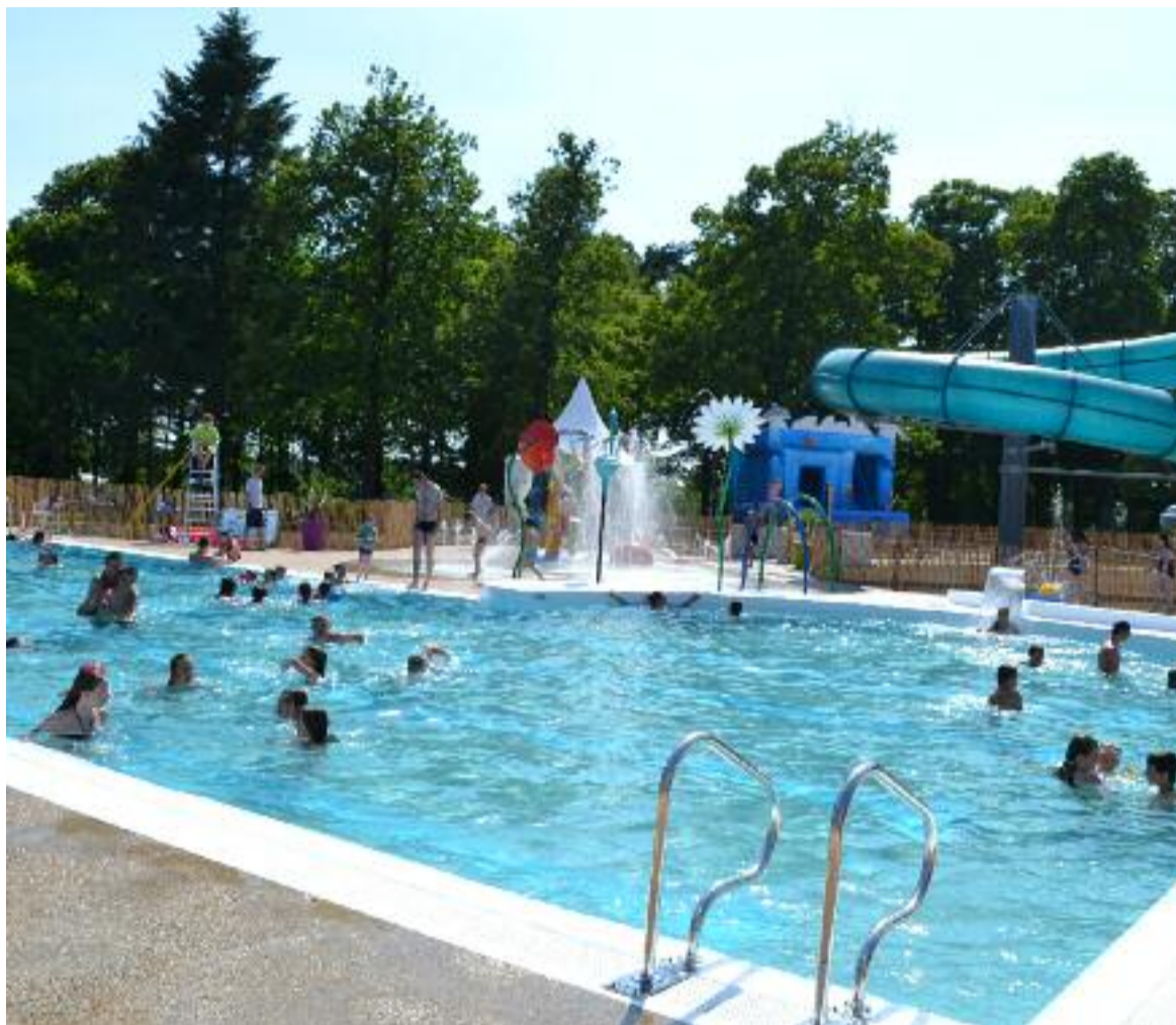
Inauguré le 13 juillet dernier, l'espace extérieur n'a pas désempli de tout l'été.

fonctionnera de nouveau lors de l'ouverture de l'espace bien-être qui comprendra également une salle de repos.