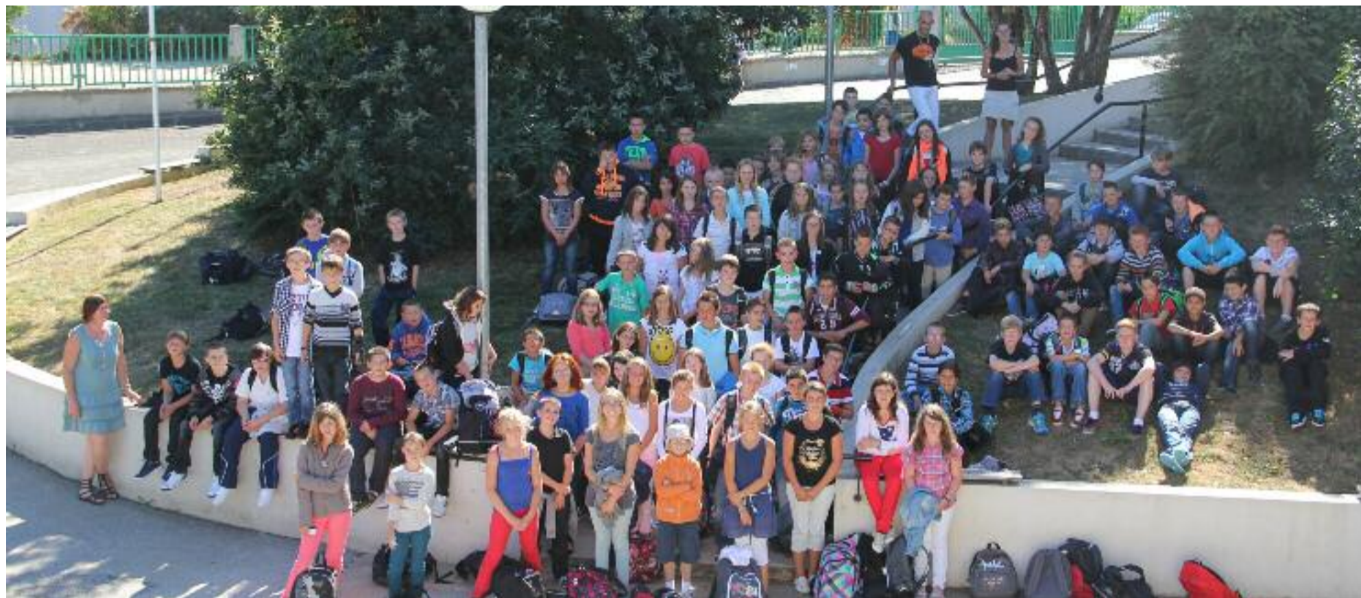
Au collège Beg-Avel, les 6e ont pu profiter de leur journée de rentrée pour prendre leurs marques, avant l'arrivée des autres sections le lendemain.