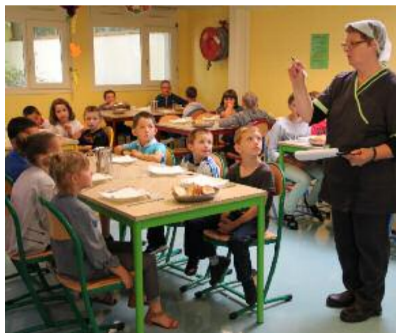
À Persvien, le menu de rentrée, c'était : melon, poisson pané au citron accompagné de riz bio et brocolis et suivi d'un petit-suisse .