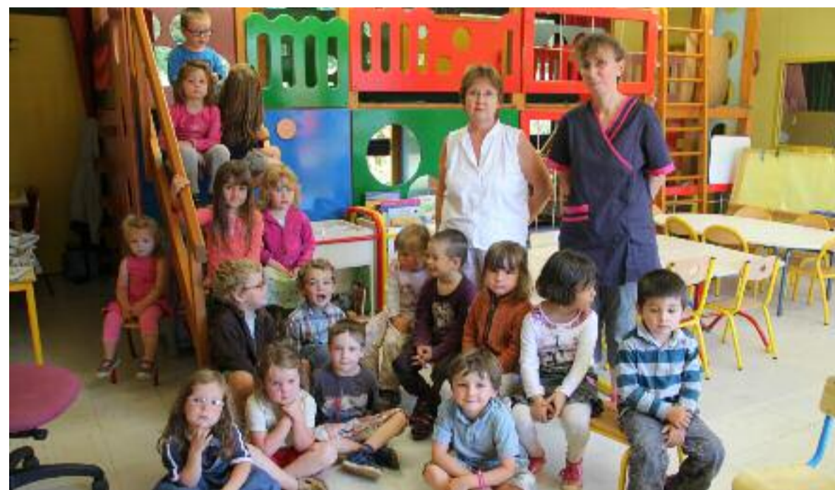
À l'école Diwan, le rassemblement pour un moment de lecture.