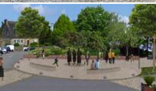
Page 3 : La place du Champ de Foire réaménagée