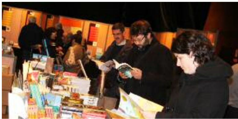
Chaque année, le Festival du Livre en Bretagne attire près de 10 000 visiteurs.

Pour préparer cette édition, les organisateurs se sont