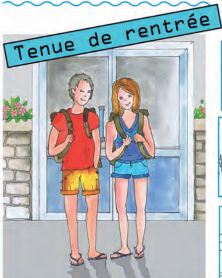
Tenue de rentrée