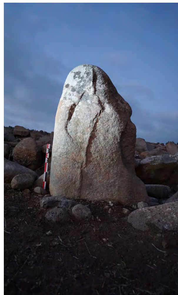
Pierre dressée de Qana Maabour à Menjez, au Liban.

Centre Vorgium. 5 rue du docteur Menguy. Entrée gratuite. 02 98 17 53 07 - accueil.vorgium@poher.bzh