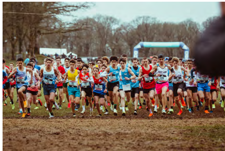
Après le championnat de France de cross en mars dernier, Kerampuilh sera à nouveau le point de rendez-vous des coureurs, du 22 au 29 novembre.

L'événement débutera le mercredi 22 novembre, avec les championnats du Finistère de cross UNSS, puis place au cross universitaire le jeudi 23 novembre.