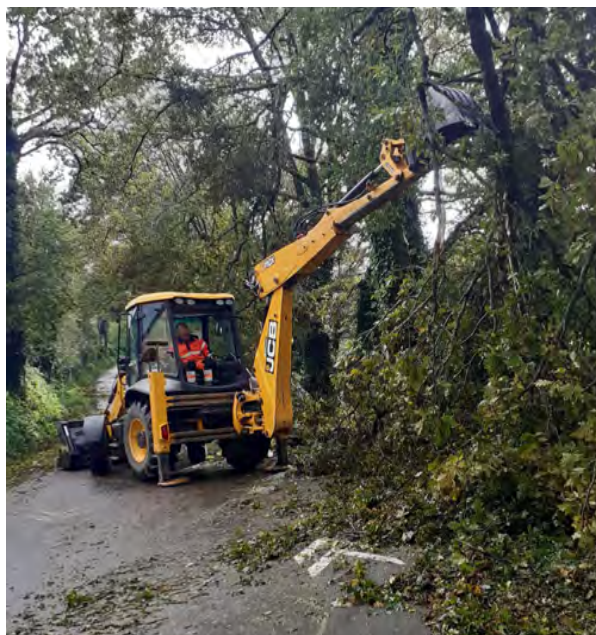
Les équipes techniques à pied d'œuvre route de Kerlédan

Le territoire du Centre Bretagne a été particulièrement touché par la tempête Ciaràn. Beaucoup de foyers se sont retrouvés sans électricité et sans moyens de communications pendant de nombreux jours. Dès le lendemain, la solidarité s'est organisée. L'entraide ici n'est pas un vain mot : les voisins, les agriculteurs, les associations se sont organisés pour venir en aide aux sinistrés.