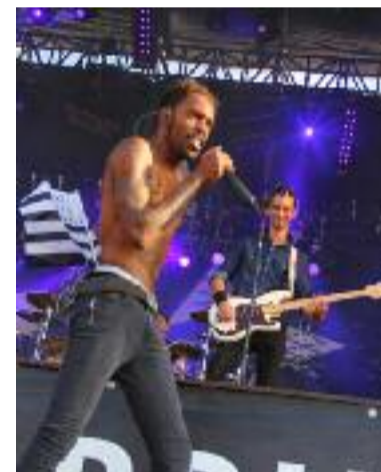
L'énergie de Skip The Use.