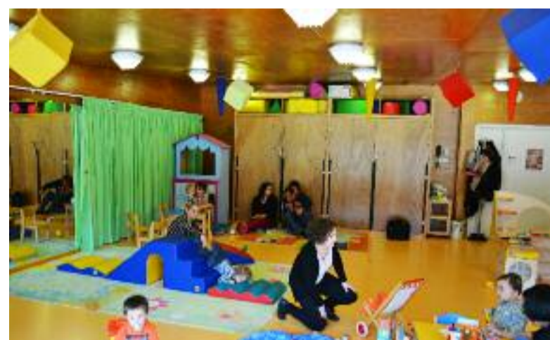
La Roulotte, lieu d'accueil des 0-4 ans et de leurs parents.

Destiné aux futurs parents et aux enfants âgés de 0 à 4 ans accompagnés des parents ou des grands-parents, cet espace est un lieu de vie, d'écoute, d'accompagnement et de soutien où l'on peut partager ses