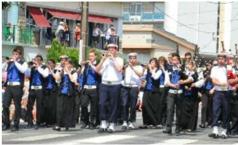
Défilé du Bagad lors du Festival Interceltique à Lorient.

pris notre temps, comme on savait qu'on passait en avant dernière position. On a fait une répétition devant la Maison des Services publics. Les gens s'arrêtaient pour nous encourager, c'était sympa. » Travail payant puisque le bagad décroche un 17,29, « ce qui nous donne une note générale, entre le concours de Vannes et celui de Lorient, de 16,93. Ceux de Beuzec ont fini seconds à Lorient mais nous passent devant au