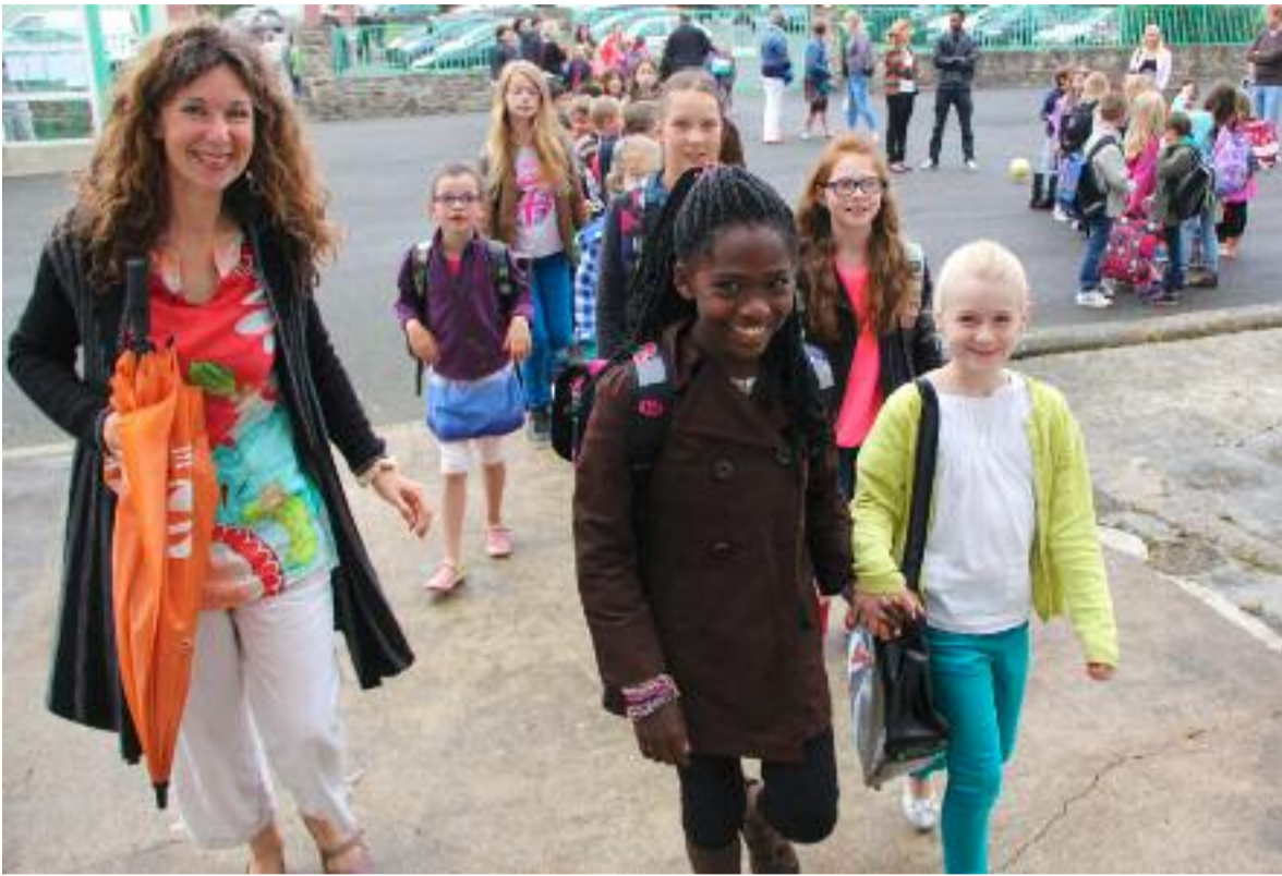
Au Boulevard de la République, on avait sorti son plus beau sourire pour la rentrée.

Une pointe de stress, des sourires à la volée, quelques larmes, le plaisir de retrouver ses copains, la rentrée est passée par là. 772 écoliers, 784 collégiens 1 071 lycéens et 125 jeunes de l'EPMS ont retrouvé les salles de classes.