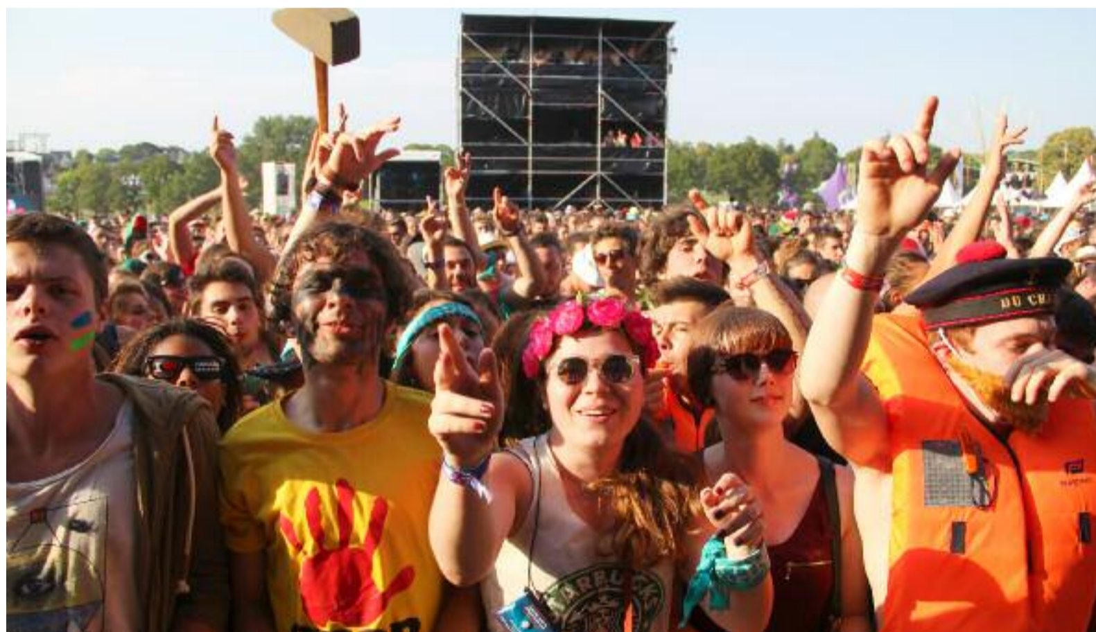
225 000 festivaliers, pour 175 000 entrées payantes (la jauge d'équilibre étant d'environ 170 000 entrées), la 23 ème édition des Vieilles Charrues est un bon cru !