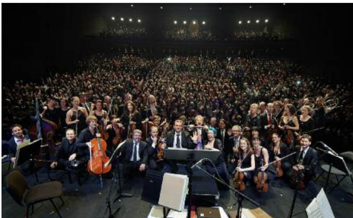
L'Ensemble Matheus revient pour un opéra de Mozart avec 40 musiciens et 5 solistes le 14 décembre prochain.