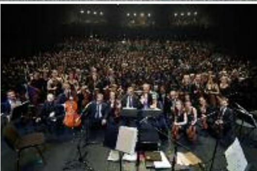
Pages 14 et 15 : Le Glenmor dévoile sa riche programmation