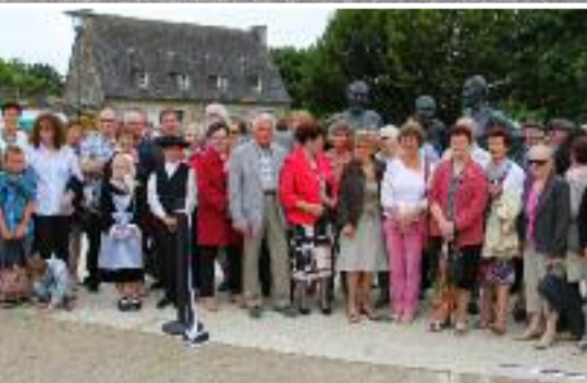
Page 3 : Les statues des Sœurs Goavec fêtées