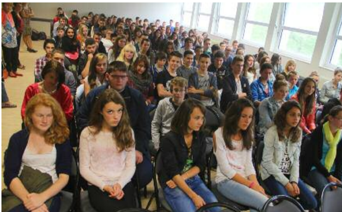
Petite réunion de rentrée pour les élèves de Seconde du lycée Sérusier, de quoi rappeler les enjeux.