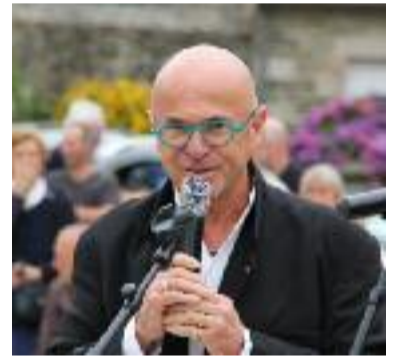
Yann Fañch Kemener a chanté en l'honneur des Sœurs.

" À travers cette première réalisation, cette sculpture des sœurs Goadec, la Ville de Carhaix a tenu à rendre hommage à toutes les femmes du centre-Bretagne, à la langue bretonne et au chant populaire breton. Elle complète des œuvres déjà implantées sur la ville comme la statue du celtisant La Tour d'Auvergne ou encore le magnifique monument aux morts de la guerre 14 réalisé par l'artiste Quillivic, place de Verdun."