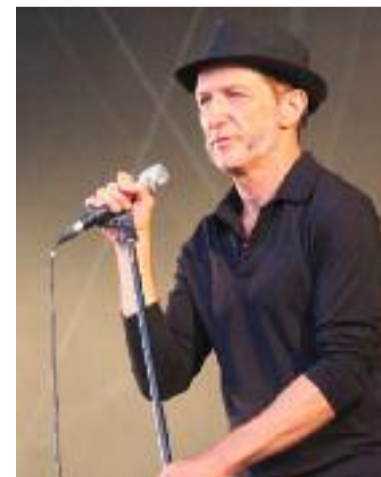
Le Brestois Miossec a livré un très beau concert.