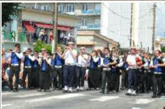
Page 16 : Le Bagad Karaez en 1 re catégorie !