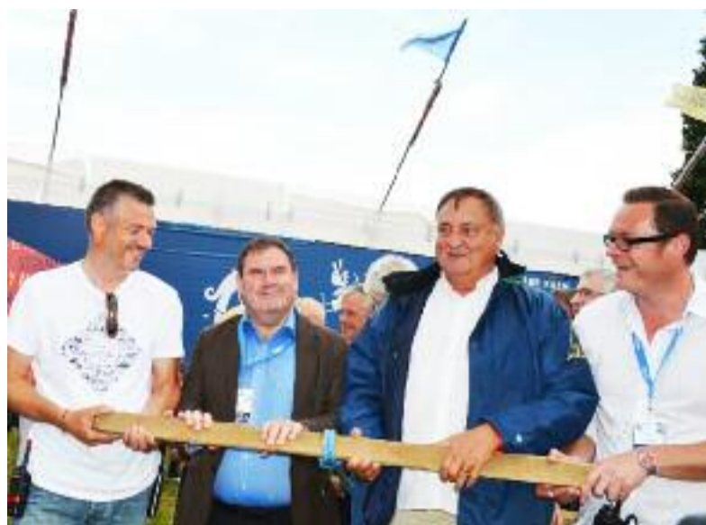
Le traditionnel tiré de charrues a donné le La du festival des Vieilles Charrues, le 17 juillet dernier, juste devant les entrées du site.