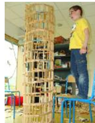
Le jeu et le plaisir de jouer à la ludothèque Bisibul.

laroulotte.poher@gmail.com Pratique : Maison de l'enfance 7, route de Kerniguez 29 270 Carhaix-Plouguer Tél : 02 98 99 44 45