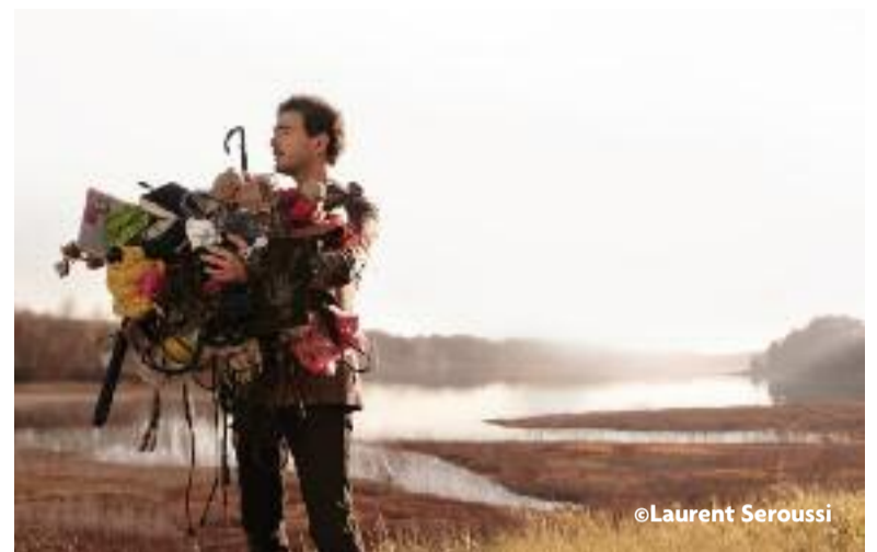
Renan Luce sera en concert le 8 novembre.

Le 7 décembre, un nouveau rendez-vous de théâtre de boulevard devrait remplir l'amphi, avec "Mariage plus vieux, mariage heureux", une