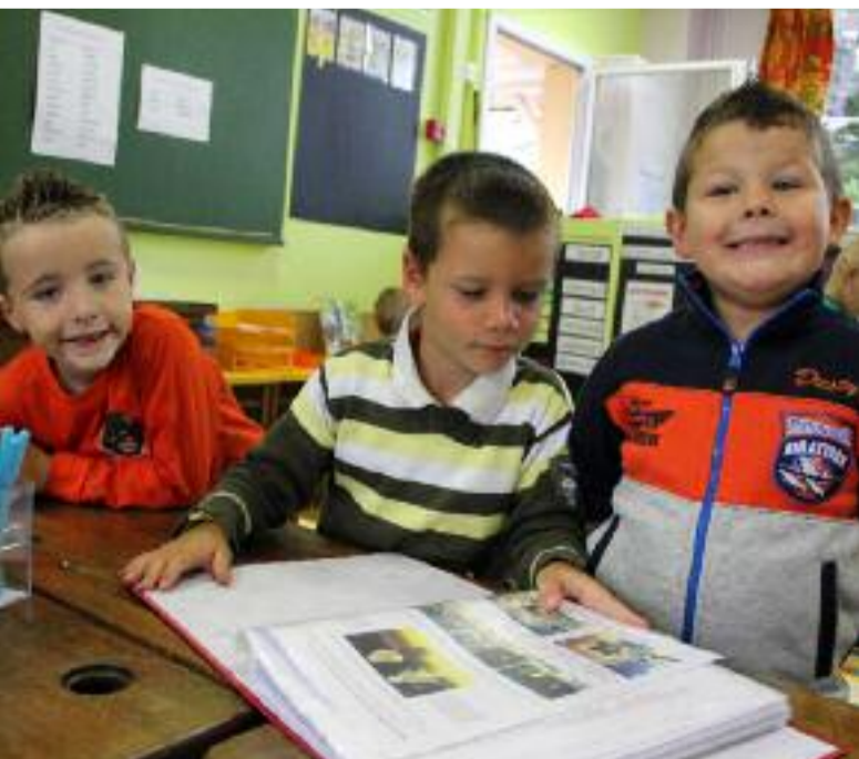
Contents de retrouver les copains à l'école de l'Enfant Jésus.

Ce groupe d'accueil fait suite à un appel à projet lancé par l'Agence régionale de santé (ARS) courant 2014, après une enquête d'un cadre socio-éducatif de l'EPMS auprès des professionnels de santé et de cadres sociaux du Pays Cob.