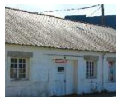
L'école Huella, le Petit Clos, la Maison du Parc et la Maison des syndicats seront équipés de panneaux photovoltaïques.

L'objectif du programme Hanter Kant (2013-2015) est la couverture de 50 % de la consommation énergétique du territoire par des énergies renouvelables d'ici 2020.