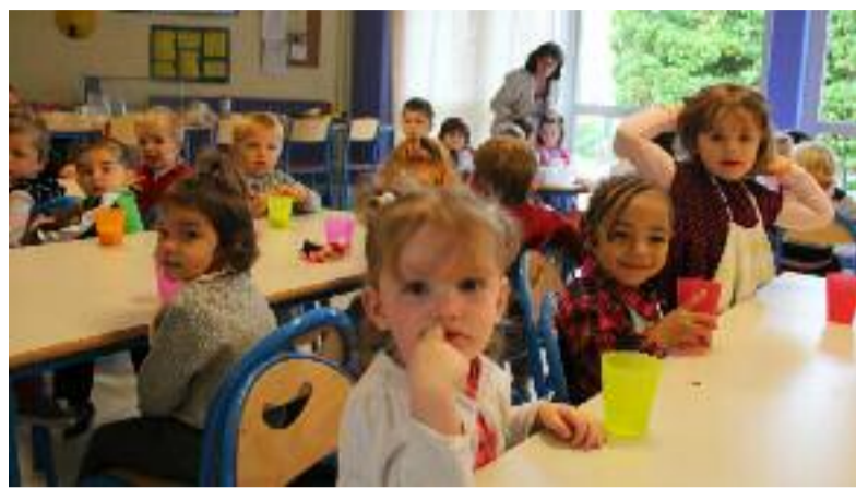
À Kerven, petit en-cas de rigueur en milieu de matinée pour reprendre des forces.