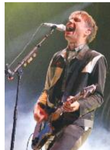
Franz Ferdinand au top !