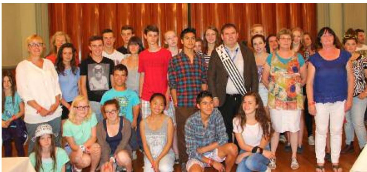
La Ville de Carhaix entretient des liens d'amitié depuis 2009 avec Woodstock aux États-Unis. Le 20 juillet, une délégation de 11 jeunes, les accompagnateurs et leurs homologues bretons étaient accueillis en mairie.