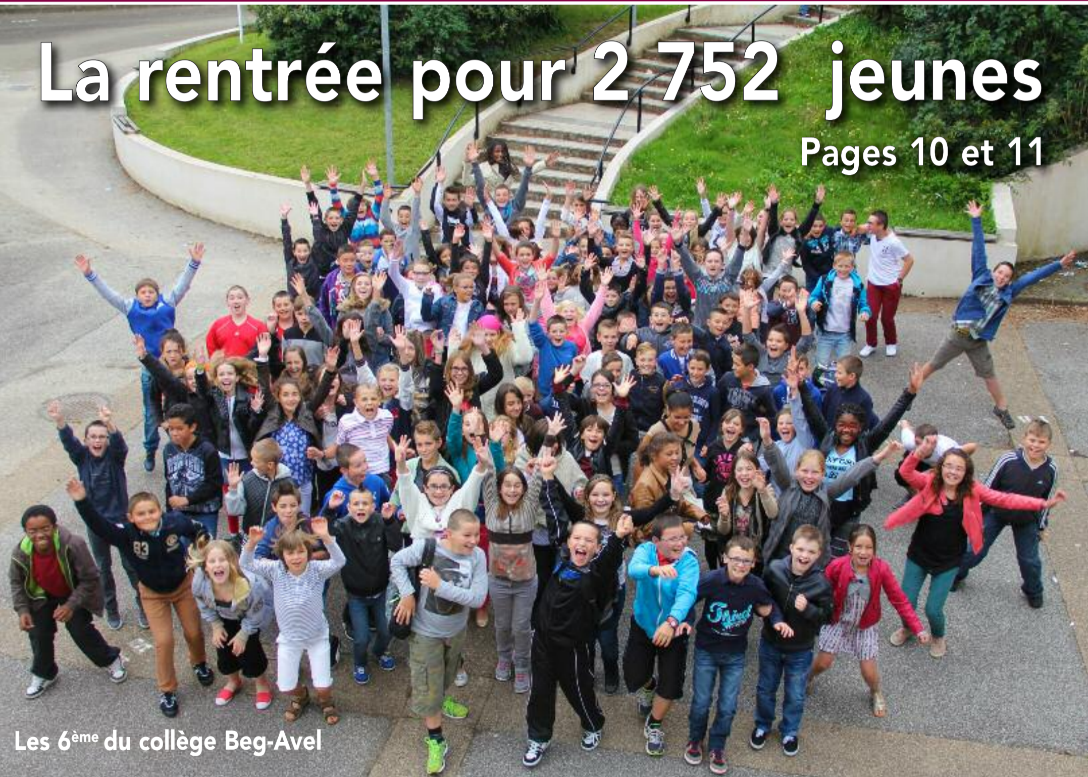
Les 6 ème du collège Beg-Avel