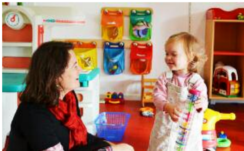
Le Relais assistante maternelles (RAM), un lieu d'échanges.

Ce service permet également aux assistantes maternelles qui le souhaitent, un soutien et un accompagnement dans leur pratique quotidienne. Le RAM leur offre la possibilité de se rencontrer et d'échanger sur leurs expériences. Des formations « ateliers d'éveil » sont ainsi proposées aux assistantes maternelles.