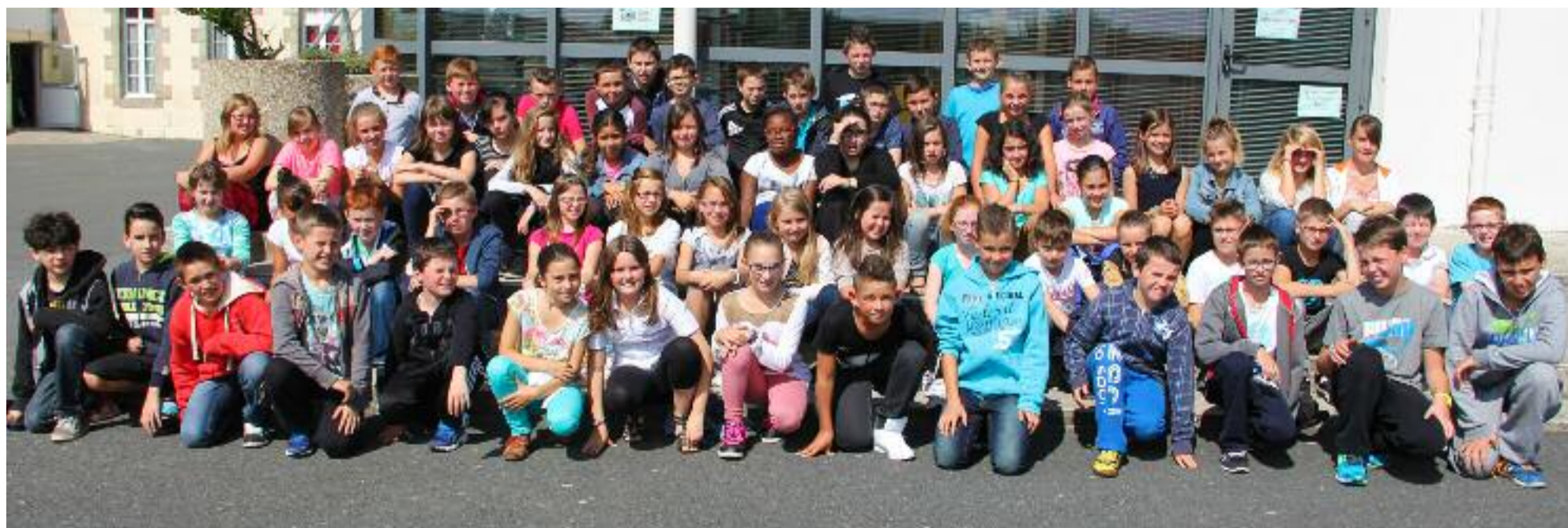
63 élèves de 6 ème ont fait leur première rentrée au collège Saint-Trémeur.