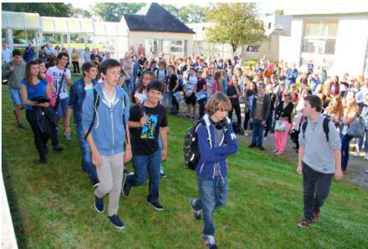
Au lycée Diwan, les élèves de Seconde ont fait leur rentrée après les autres, le mercredi.