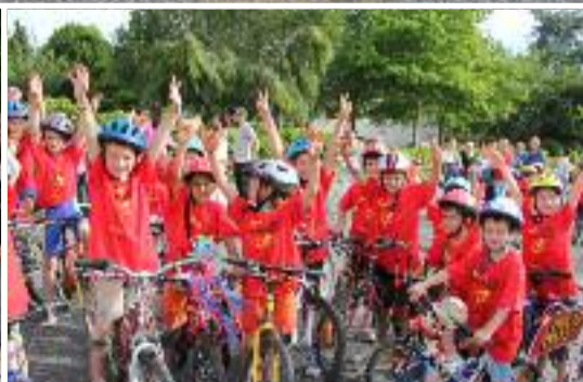
Pages 6 et 7 : Retour sur l'été en photos