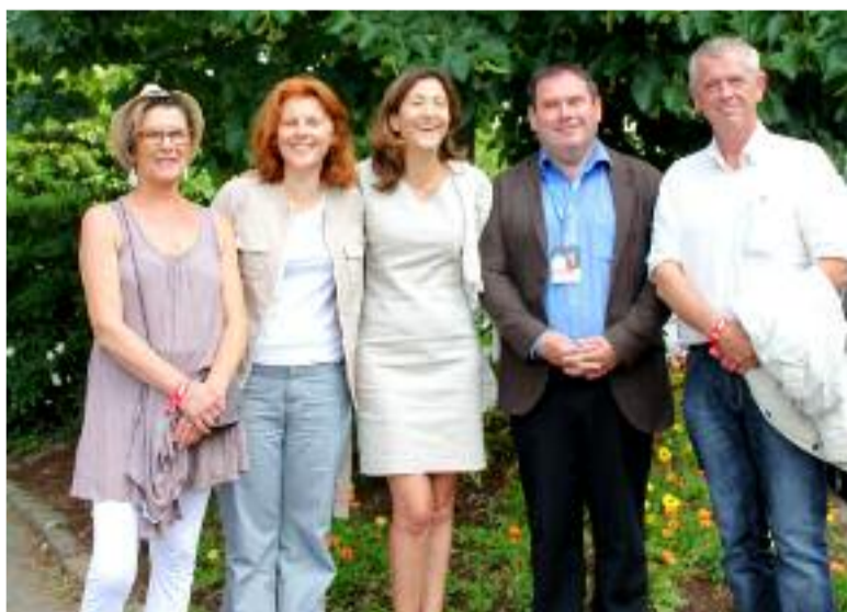
Invitée à l'École des Filles d'Huelgoat, l'ex-otage franco-colombienne Ingrid Betancourt s'est rendue, place de l'Église, devant l'arbre de la Liberté planté en son nom lors de sa captivité.