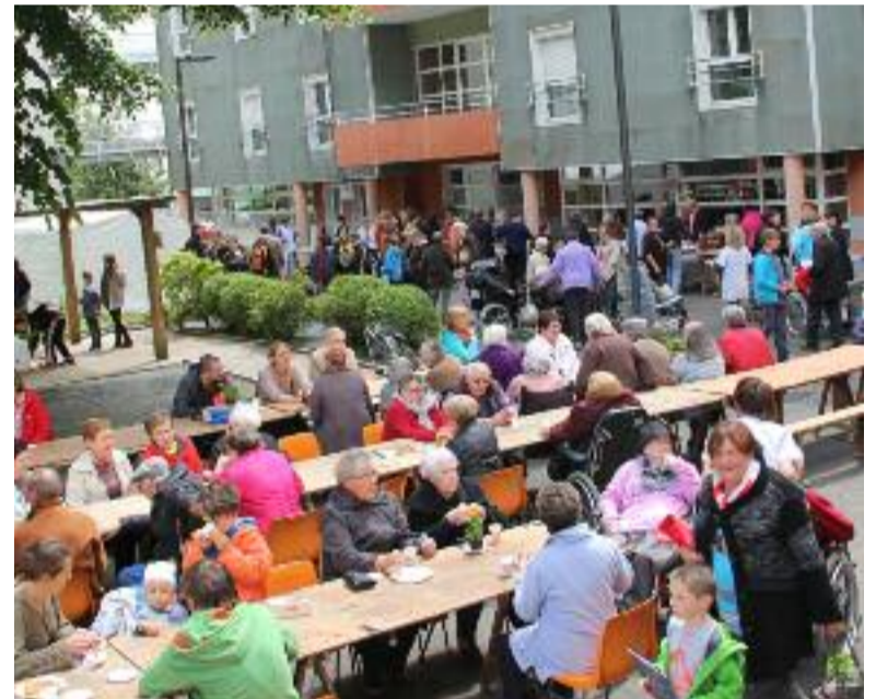
Encore une grosse affluence à la kermesse intergénérationnelle organisée, le 4 juin dernier à la maison de retraite de Kervel.