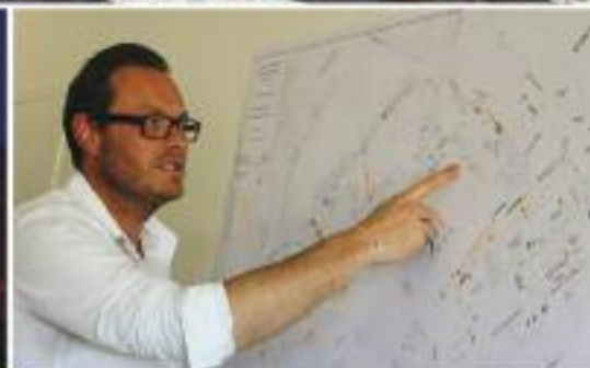
Page 16 : Les Vieilles Charrues vont surprendre