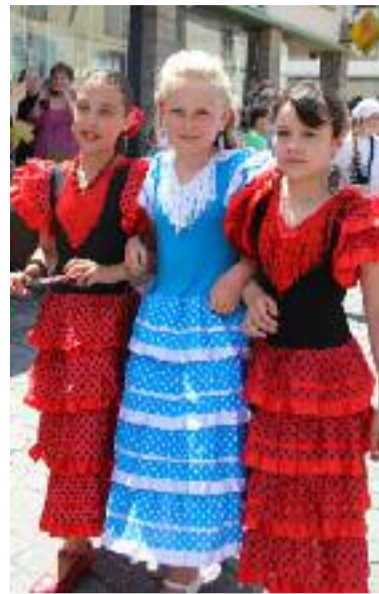
Danseuses de flamenco sous le soleil exactement.