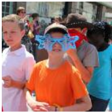
Des lunettes de star !