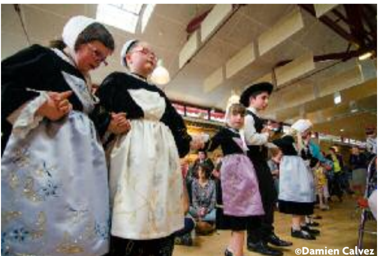
Les Goûters du monde ont dû se réfugier aux Halles à cause du temps, le 21 mai dernier. Ce qui n'a en rien gâché la fête pour des centaines de personnes venues goûter les mets sucrés et salés confectionnés par les familles et assister aux animations proposées.