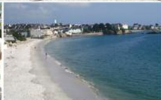
Page 8 : Carhaix plage repart cet été