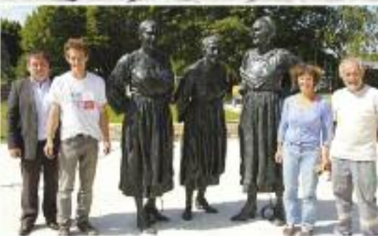
Page 3 : Inauguration des statues des Sœurs Goadec le 12