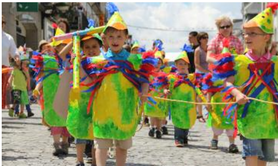
Du peps et de l'énergie à revendre pour les écoliers de Kerven.