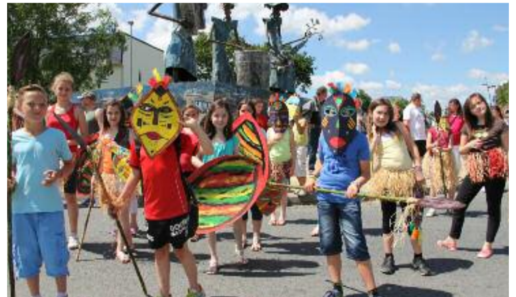
Les Zoulous ont volé la vedette aux géantes Musiciennes, le temps du défilé.