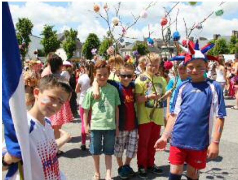
Pour le défilé des écoles publiques, leur manière à eux d'encourager l'équipe de France pour le Mondial de football au Brésil.