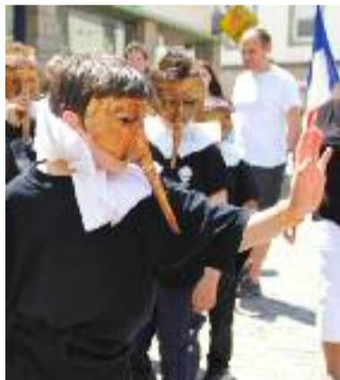
L'école de Persivien avait choisi d'embarquer pour Venise.