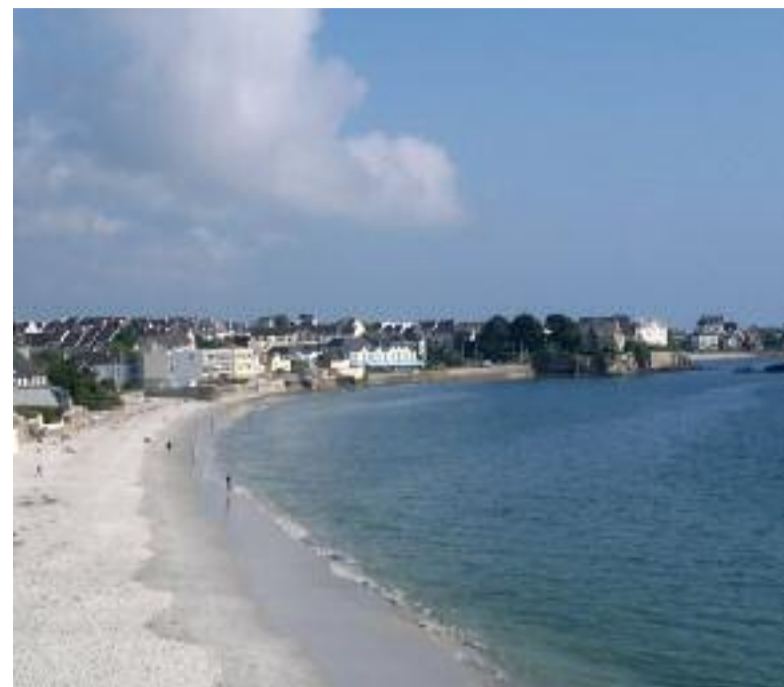
La plage des Sables-Blancs à Concarneau.