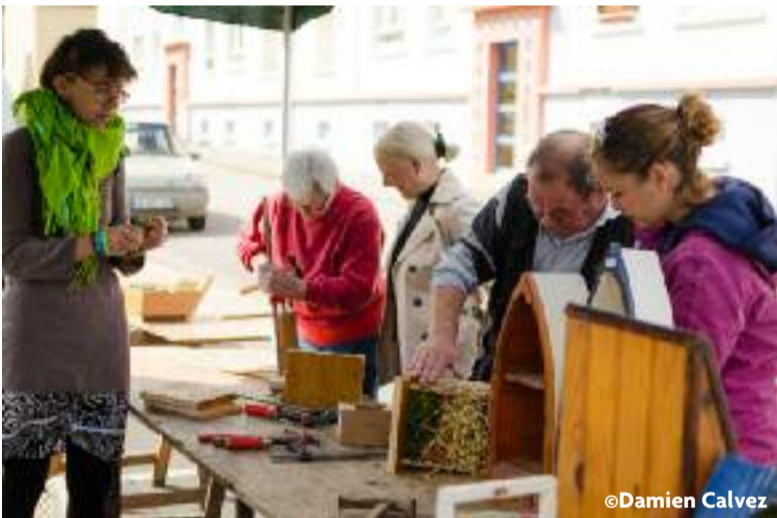
Le 14 mai dernier, Poher communauté et ses partenaires (Ville de Carhaix, Habitat 29 et ressourcerie Ti'Récup) organisaient la Journée des jardins aux jardins familiaux du Bois-Blanc. Avec de nombreuses animations prévues, telles que la confection d'hôtels à insectes (photo ci-dessus).