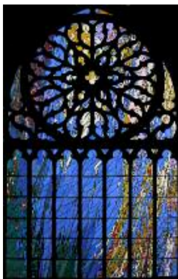
Parmi les investissements 2013 : le nouveau vitrail de l'église Saint-Trémeur, la réfection du carrefour du Kreiz Kêr et l'aménagement du parc du Château Rouge.

Côté travaux, un mur a également été réalisé rue Fontaine Lapig, en prévision du réaménagement du carrefour. 30 000 €, dont la moitié a été financée par la DETR (Dotation d'équipement des territoires ruraux), ont servi à l'installation d'un nouveau préau à l'école de