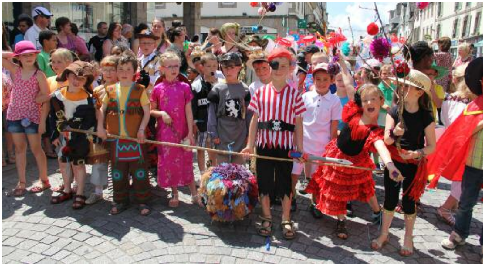
Les carnivals du monde, le thème imposé cette année pour les costumes, étaient au rendez-vous du défilé des écoles publiques qui s'est déroulé le 14 juin dernier, de la place de la Tour d'Auvergne jusqu'à l'école de Persivien où avait lieu la kermesse avec, pour ouvrir la marche, des musiciens du Bagad.