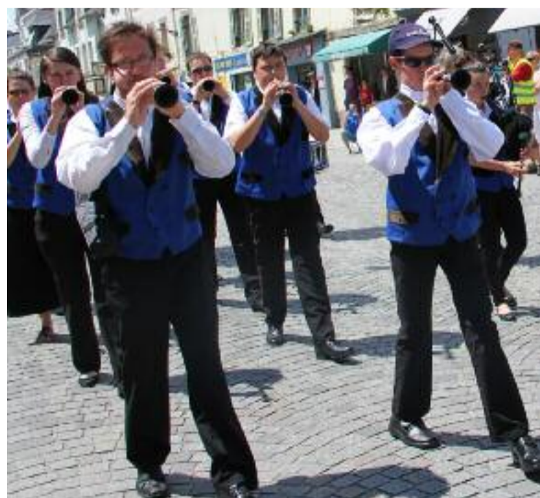
La Bagad Karaez ouvrira le défilé dans le haut de la Grande Rue.