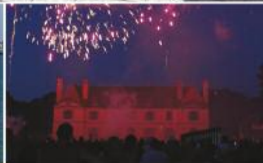
Page 11 : Soirée Digor Kalon le 13 juillet