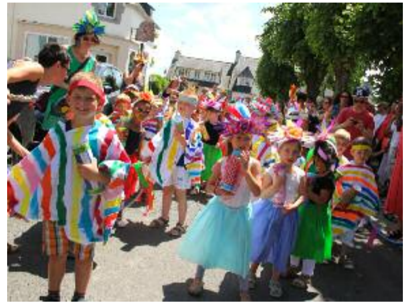
Petite mise en ordre des troupes avant le grand départ du défilé.