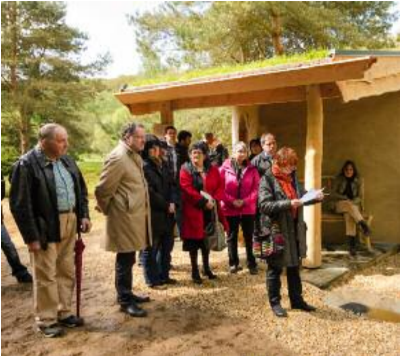
L'inauguration de l'abri écologique de la Vallée de l'Hyères avait lieu le 12 mai dernier, en présence des responsables de Cob Formation, initiateurs du projet, des partenaires (Ville de Carhaix, Région Bretagne, Conseil général du Finistère et Pôle Emploi) et de tous les intervenants. Ce chantier école en préqualification a duré cinq mois et a permis à 10 stagiaires de s'initier à des pratiques raisonnées de construction.