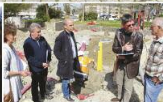
Pages 10 et 11 : Tour d'horizon des travaux en ville