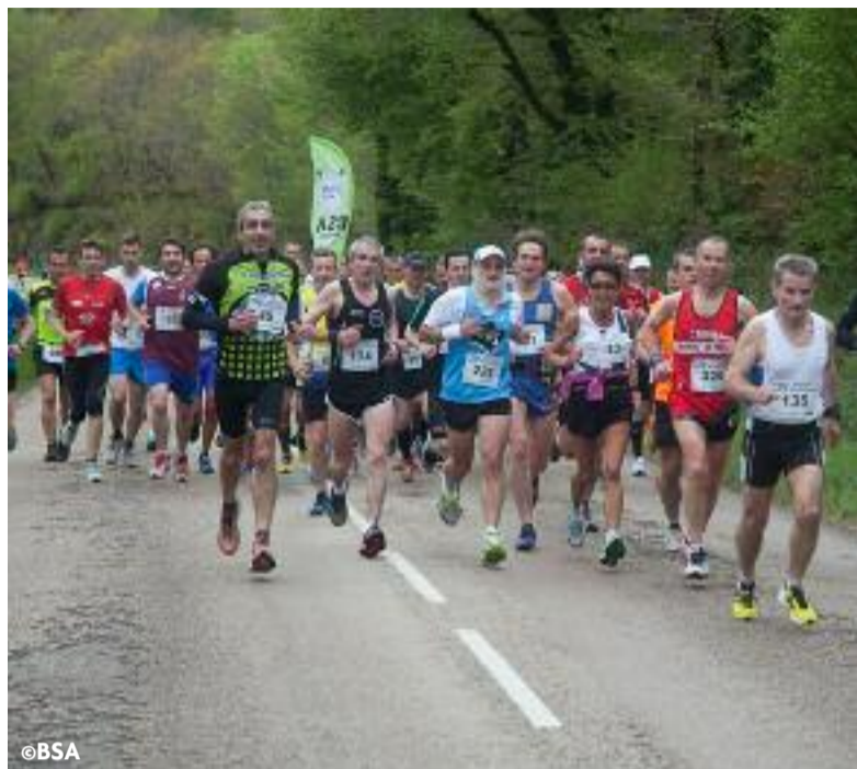
Breizh Sport Attitude attend 1 100 coureurs pour cette 10 ème édition.

L'association Breizh Sport Attitude organise la 10 ème édition des courses pédestres Huelgoat-Carhaix le samedi 10 mai.