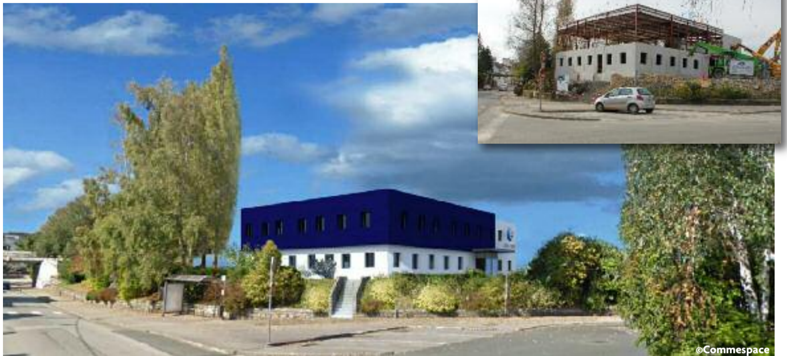
Les travaux de construction du nouveau bâtiment Pôle Emploi, après le pont de la gare, sont en cours (photo médaillon).

La société a ainsi racheté un terrain de stockage de 2 600 m 2 à Réseaux Ferrés de France, après le pont de la voie de chemin de fer, avenue Victor Hugo. Commespace a investi dans la construction de ce bâtiment de plus de 7 m de haut et 700 m 2 de surface au plancher. Avec un rez-de-chaussée en béton, un