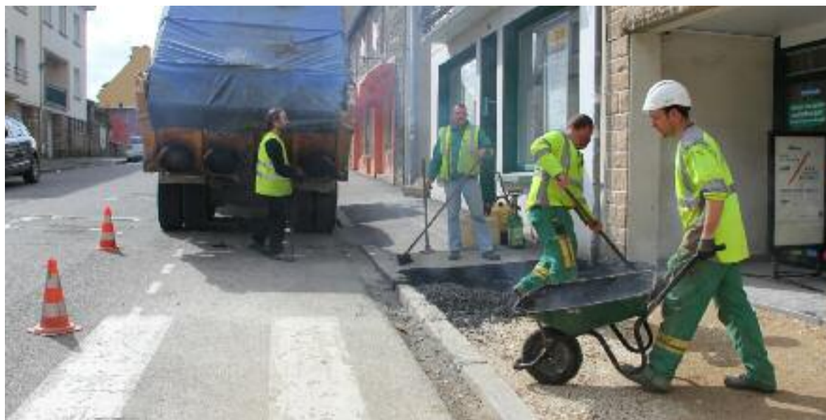
Afin de rendre les trottoirs plus accessibles, plusieurs bateaux ont été aménagés en ville, comme ici dans la Grande Rue, de chaque côté de la rue, en contrebas du Château Rouge.

Les travaux de réaménagement de la place du Champ de Foire ont démarré le 7 octobre dernier. Ces travaux s'inscrivent dans le prolongement de l'aménagement de la zone pavée du carrefour du Kreiz-Kêr et l'élaboration du schéma directeur d'aménagement du centre-ville. « Ce nouvel espace, autour des statues des Soeurs Goadec, permettra de maintenir la liaison piétonne et des personnes à mobilité réduite, vers la place du Champ de Foire. »