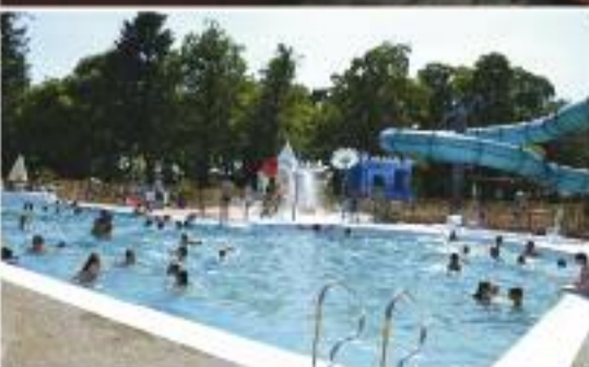
Page 3 : Plijadour : le park extérieur a rouvert !