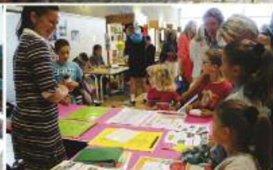
Page 6 : 220 242 € de subventions pour les associations